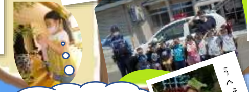
ねがいがかないますように