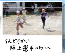
うんどうかい 陸上選手みたい〜