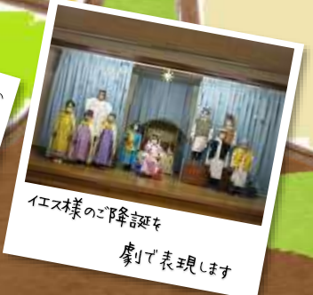
イエス様のご降誕を 劇で表現します