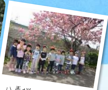
八重桜の木の下で