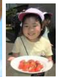
園庭で 獲れたての