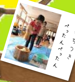
おもちつき べったんべったん