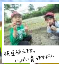
枝豆植えます。 いっぱい育てますように