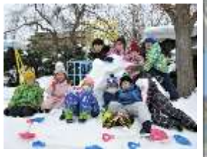
雪遊び 広い園庭でなかよく遊ぶよ!