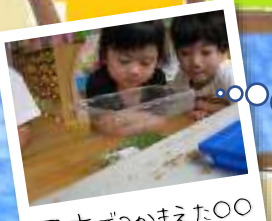
園庭でつかまえた〇〇