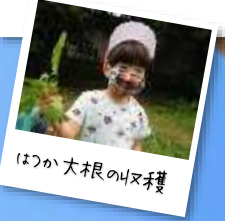
はつか大根の収穫