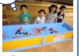
お店屋さんごっこ 金魚つり、デザート屋いろいろ