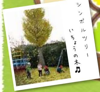
シンボリック いちじくの木