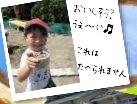
おいしい? うん〜い♪ これは たべられません