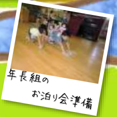
年長組の お泊り会準備