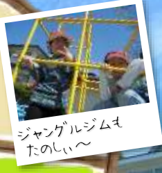
ジャングルジムも たのしい〜