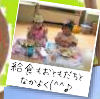
糸食もおともだち なかよく(^^)♪