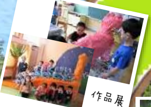
個性豊かに表現しています。