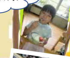
お少場での 水遊び